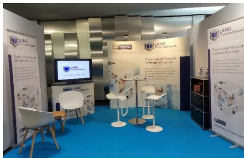
Unser Ausstellungsstand am Symposium

Auch dieses Jahr waren wir wieder als Aussteller vertreten. Auf diese Weise konnten wir zahlreiche Kontakte knüpfen, bestehende Verbindungen vertiefen und wertvolle Informationen über die Trends der Zukunft sammeln, welche wir in die Gestaltung unserer Applikationen einfließen lassen.