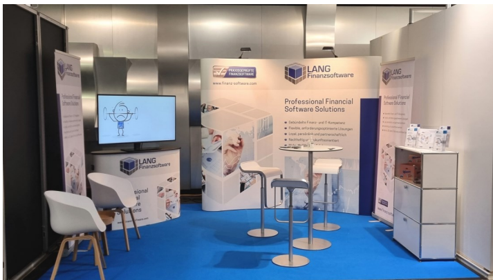
Messestand — Lang Finanzsoftware

Auch dieses Jahr, nach einer langen pandemiebedingten Pause, waren wir wieder als Aussteller vertreten. Auf diese Weise konnten wir zahlreiche Kontakte knüpfen, bestehende Verbindungen vertiefen und wertvolle Informationen über die Trends der Zukunft sammeln, welche wir in die Gestaltung unserer Applikationen einfließen lassen.